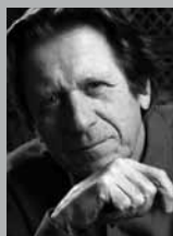
Albert Millaire, C.Q.