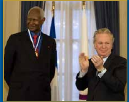
Le premier ministre a promu au grade de grand officier de l'Ordre national du Québec Son Excellence Abdou Diouf, secrétaire général de l'Organisation internationale de la Francophonie.