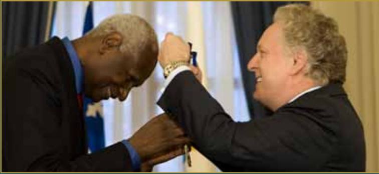
Le premier ministre du Québec remettant l'insigne de grand officier de l'Ordre national du Québec au secrétaire général de l'Organisation internationale de la Francophonie, Son Excellence Abdou Diouf.