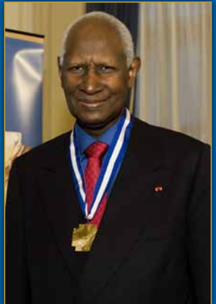
Son Excellence Abdou Diouf, G.O.Q., grand ami du Québec et architecte du renouveau francophone.